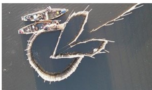
Série Documental "Espelho da Baía" - Filmagens drone Pesca de Curral - Magé-RJ

públicas voltadas para a conservação e gestão ambiental da Baía de Guanabara.