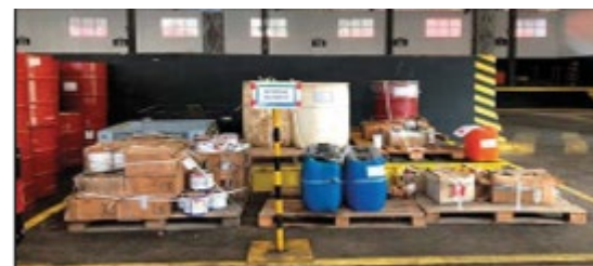
Separação de materiais na unidade de apoio Wilson Sons

O Projeto de controle de Poluição (PCP) tem o objetivo de monitorar, controlar e mitigar os impactos causados pela geração de resíduos sólidos e efluentes provenientes das atividades de exploração e produção de petróleo e gás natural, realizada pela unidade offshore FPSO Cidade de Caraguatatuba, de acordo as diretrizes estabelecidas pela Nota Técnica 01/11 do Ibama. O projeto prevê a realização de um conjunto de procedimentos, tanto a bordo das unidades marítimas e embarcações inseridas nesses processos de licenciamento, quanto fora delas, que buscam minimizar a poluição advinda da geração de resíduos a bordo, de sua disposição em terra, do descarte de rejeitos no mar e das emissões atmosféricas.