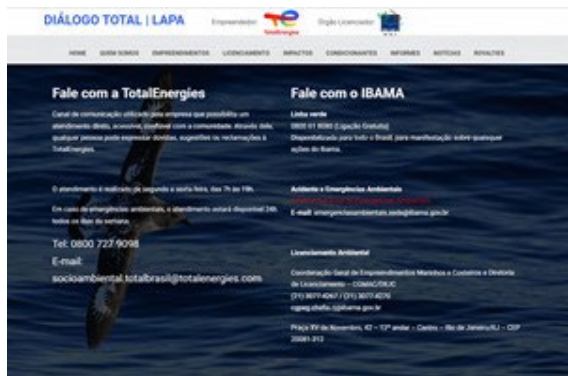
Site DIÁLOGO TOTAL | LAPA

O Projeto de Comunicação Social (PCS) tem como principal objetivo informar ao público do projeto, especialmente aquele ligado às atividades de pesca, sobre as atividades realizadas pela TotalEnergies no Campo de Lapa. Além disso, são informados os resultados dos projetos de mitigação em curso, exigidos no licenciamento ambiental federal.