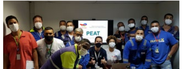
Realização do PEAT para os trabalhadores da unidade de apoio Wilson Sons - Caju/RJ

O projeto busca informar os trabalhadores sobre os aspectos ambientais da atividade e os impactos ambientais associados e como estes últimos podem ser evitados e/ou minimizados. É implementado em dois ciclos: Básico e Continuando, conforme como estabelece a Nota Técnica 05/2020. Depois de um período de treinamentos online, como uma forma de adaptação à pandemia causada pela Covid-19, as ações do PEAT voltaram a ocorrer nos formatos presencial e também no formato online.