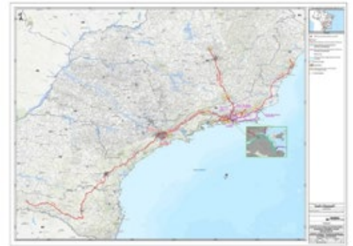
Mapa de utilização das Vias de Acesso