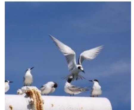
Avistagem na FPSO Cidade de Caraguatatuba

O projeto prevê ainda a captura de aves debilitadas e envio para centros especializados onde ela recebe os devidos cuidados, de uma equipe especializada, antes de ser devolvida ao seu habitat. Para isso, são previstos procedimentos de captura segura e cuidados a bordo até que seja possível enviá-las, com segurança, para os centros de resgate e recuperação. Tanto o registro de ocorrências, quanto os procedimentos mencionados anteriormente são realizados por um time de profissionais devidamente treinados para esse fim.