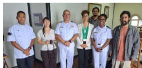
Imagem de ação com representantes da Marinha do Brasil – RJ

Como resultado dessas interações ilustradas acima, o projeto executou dois vídeos de apresentação que podem ser acessados pelo site do projeto: https://pearedesdabaia.com.br/ .