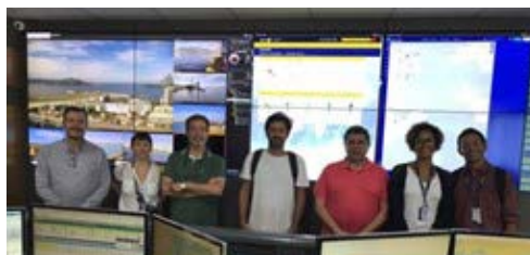
Imagem de praticagem - Rio de Janeiro