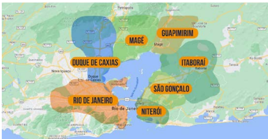
Municípios de abrangência do PEA Redes da Baía

Como pode ser visto no mapa abaixo, o PEA Redes da Baía atua em sete municípios do espelho d'água da Baía de Guanabara: Rio de Janeiro, Duque de Caxias, Magé, Guapimirim, Itaboraí, São Gonçalo e Niterói.