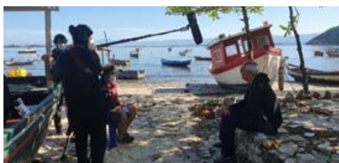
Imagem de entrevista com representante da Pesca Artesanal – Niterói