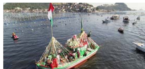
Imagem da Festa de São Pedro realizada em 2022