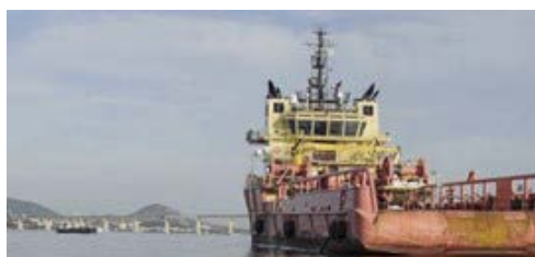
Imagem de embarcação de apoio logístico