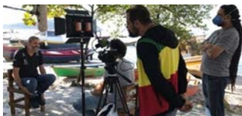
Imagem de entrevista com representante do Projeto Uça – Petrobras