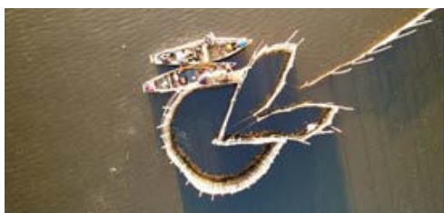
Imagem de pesca artesanal de Curral - Magé