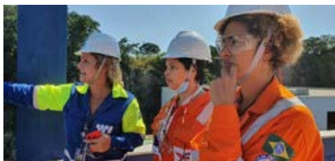
Imagem de ação na Base de apoio logístico da Wilson, Sons

A Série “Espelhos da Baía” será lançada no ano de 2023, em vários ventos nos municípios que fazem parte da área de atuação do PEA Redes da Baía. Os vídeos também serão disponibilizados nas redes sociais do projeto.