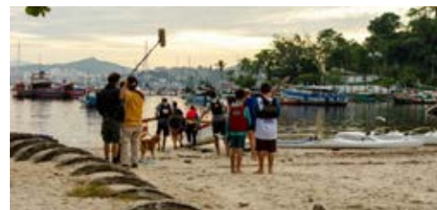
Imagem do Projeto Kamahana, Canoa Polinésia