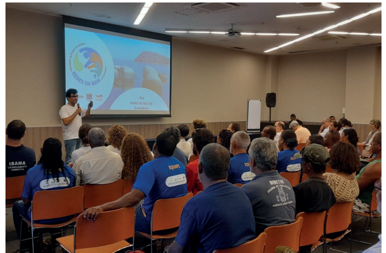
Mesa Redonda do PEA Redes da Baía da Guanabara.

Ao produzir um conteúdo com linguagem simples, de fácil acesso e com ampla difusão, o projeto se mostrou eficaz na educação e no engajamento de todos que compartilham e convivem na Baía de Guanabara.