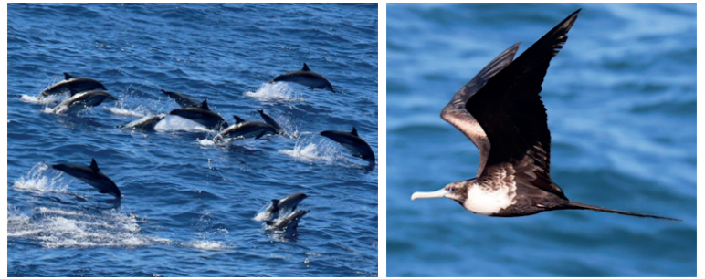
Fragata e golfinhos avistados no Campo de Lapa.

Atualmente, algumas ações já estão sendo implementadas, como a presença de um profissional qualificado responsável pelo registro, observação do comportamento e identificação dos animais, incluindo mamíferos, tartarugas, peixes e aves, que frequentam as proximidades da plataforma. Também realizamos resgates de aves marinhas debilitadas e de aves terrestres que são