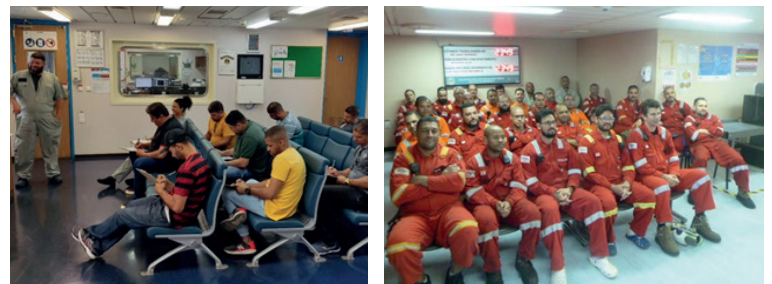
Trabalhadores offshore em treinamento no navio-sonda DS-15 e no FPSO Cidade de Caraguatatuba.

Confira abaixo imagens dos treinamentos realizados: