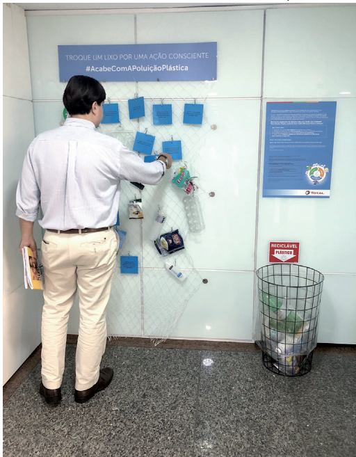
Campanha sobre uso consciente do plástico realizada no escritório para funcionários