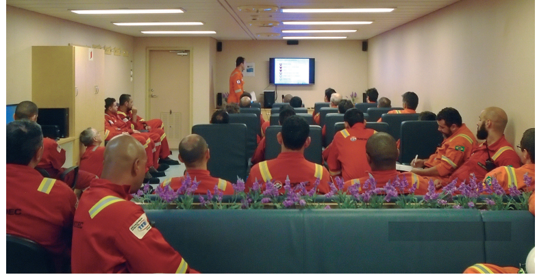
Projeto de Educação Ambiental dos Trabalhadores (PEAT) capacita equipe embarcada no FPSO Cidade de Caraguatatuba